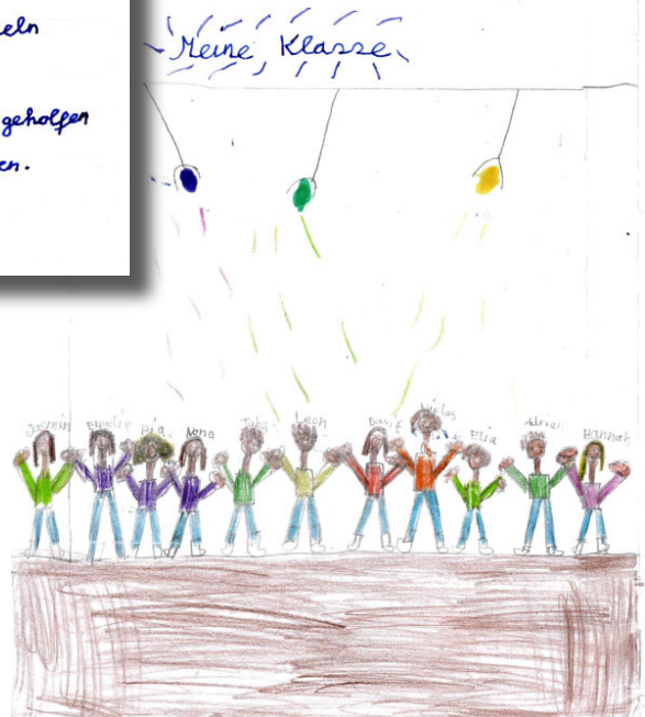
Bericht und Bild: Nona

In einem Raum haben die Eltern ein Leckeres Buffet aufgebaut. Ich habe mir den Bauch mit Apfelraut, Brezeln und Buffins vollgeschlagen. Weil meine Mama noch beim Spülen geholfen hat, sind wir bis zum Schluss geblieben. Es war ein schöner Tag.